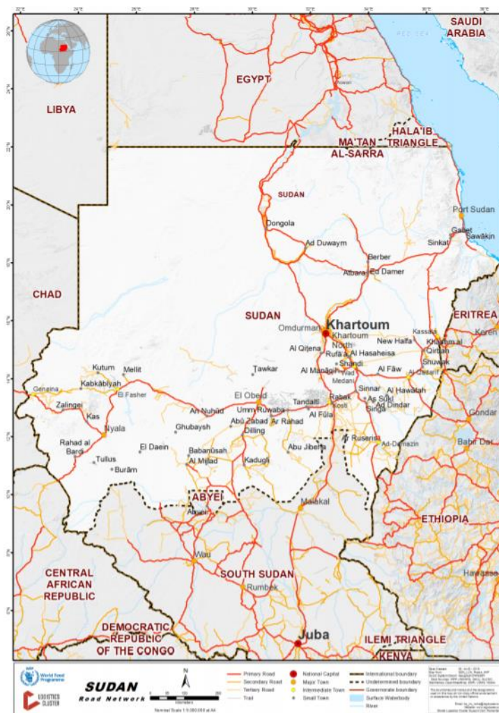
Figuur 3: Sudan Road Network (08/08/2018) 17

Onderstaande kaart toont het wegennetwerk in Soedan, en geeft de wegen weer die Khartoem via de stad El Obeid in Noord-Kordofan met verschillende plaatsen en steden in Darfoer verbindt. 16